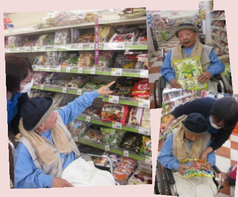
お菓子を買いたい