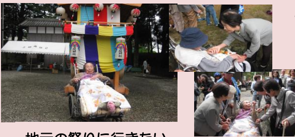
地元の祭りに行きたい