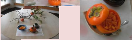
好物の柿が食べたい