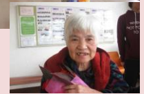
誕生日を家族と過ごしたい