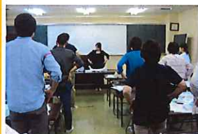
オムツ当て方講習会

新茶の季節を迎え、新茶をご用意し、新茶会を開催しました。職員が茶摘み娘になり、新緑に囲まれた清々しい空気の中、各棟でそれぞれにゆったりとしたひと時を過ごされていました。