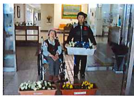
中里小よりプレゼント